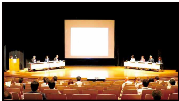
(令和6年度定期総会)

青少年の置かれている環境をよく理解し行動することや、生きづらさを抱えた青少年に気づく感性を持つことなどを、今年度の取り組みを通じて広く県民の皆さんに呼び掛けることとしました。